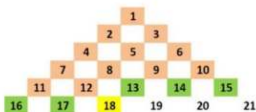
Bsp. 1: Nr. 18 kann die 17 und 16 in seiner Reihe, sowie die 15, 14 und 13 in der Reihe über ihm fordern. Nicht aber die 12 welche links über ihm steht.